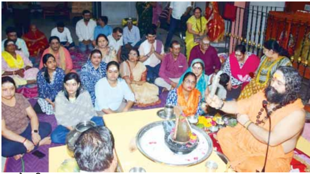
यह रहे उपस्थित-