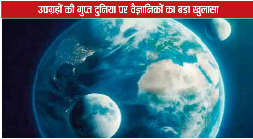
उपग्रहों की गुप्त दुनिया पर वैज्ञानिकों का बड़ा खुलासा